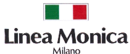
<リニアモニカ><プリーツバイモニカ>